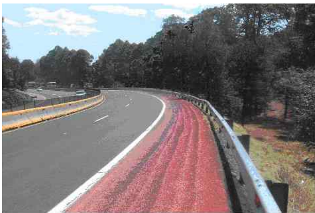
Figura 3. Fotografía de la segunda curva, durante la inspección de campo

La figura 3 muestra una vista desde el acotamiento externo hacia la salida de la segunda curva en sentido hacia Puebla, durante la inspección en campo.