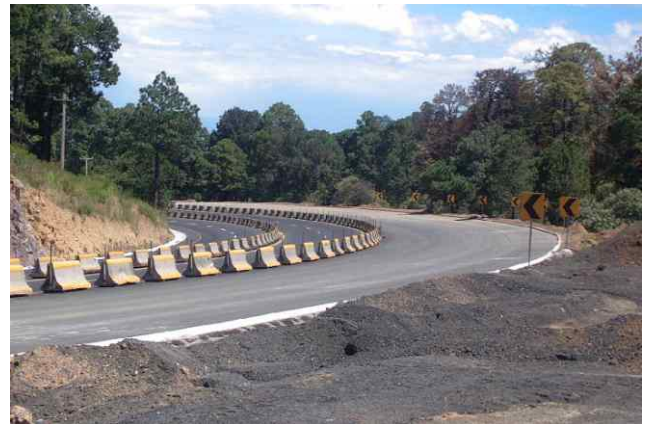
Figura 4. Fotografía de la segunda curva, durante la realización de los trabajos de mejoramiento

En México, el incremento de la seguridad vial mediante el mejoramiento de la infraestructura se ha buscado a través de la atención de puntos negros o tramos peligrosos, que es un programa de tipo correctivo; así como de la realización de auditorías de seguridad de carreteras en operación, que es un programa de tipo preventivo. La inversión anual en mejoramiento de las carreteras (construcción, modernización y conservación) asciende al orden de 0.25% del Producto Interno Bruto.